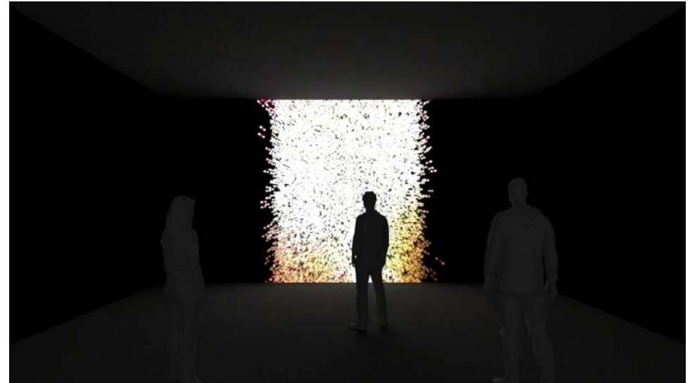
Méta-Balades à Rennes, ici sur le site de l'oeuvre architecturale du Belvédère (Ronan & Erwann Bouroullec).

SKYGGE: Lors de la promenade nocturne dans ce quartier de Rennes, il s'est mis à pleuvoir. Les gouttes de pluies ont été le point de départ d'une bande-son mêlant plusieurs technologies pour créer une voix et des arpèges à partir d'un corpus de piano de Yann Tiersen.