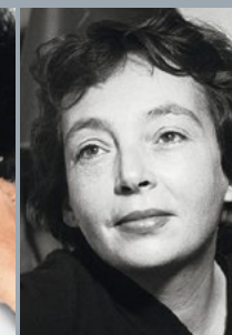
Bulle Ogier et Madeleine Renaud Savannab Bay, variations de et avec Marguerite Duras