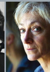
Sylvie Germain Brèves de solitude lu par l'autrice

Titres également disponibles au format numérique, téléchargeables sur www.desfemmes.fr et sur les plateformes de vente en ligne.