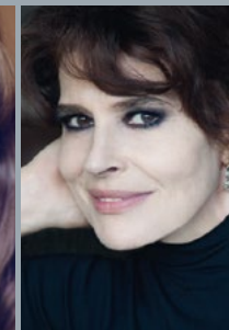
Fanny Ardant lit Moderato cantabile de Marguerite Duras