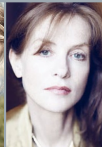
Isabelle Huppert lit Just Kids de Patti Smith